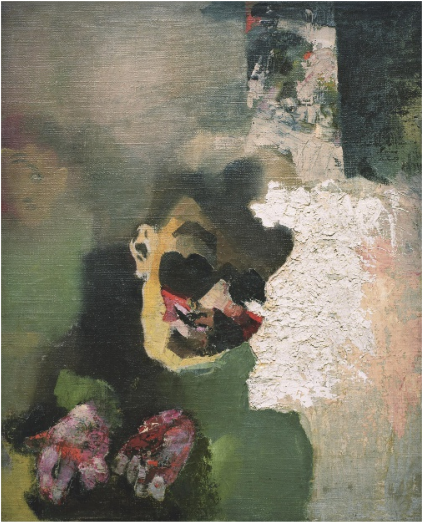
^ Geschundenes Gesicht, blutige Hände: In düsteren Farben verarbeitet Friedl Dicker-Brandeis ihre erste Verhaftung DAS VERHÖR II, 1934/35, 75 X 60 CM, ÖL AUF LEINWAND